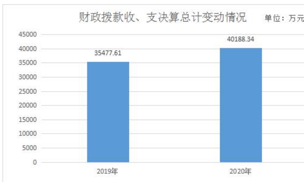
图4：财政拨款收、支决算总计变动情况

2020年度财政拨款收、支总计40188.34万元。与2019年度相比，财政拨款收、支总计各增加4710.73万元，增长13.28%。主要原因是（1）垃圾收运体制改革增加垃圾收运费、垃圾终端处理厂处理费以及垃圾跨区处置生态补偿金标准上调；（2）受突发疫情影响，增加疫情防控工作相关经费列支。