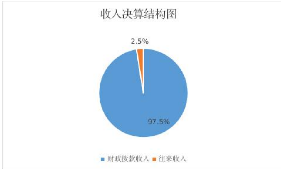
图 2：收入决算结构图