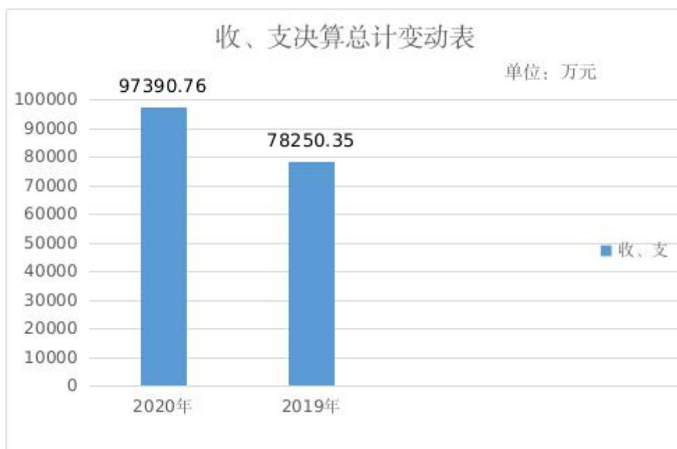
图 1：收、支决算总计变动情况图