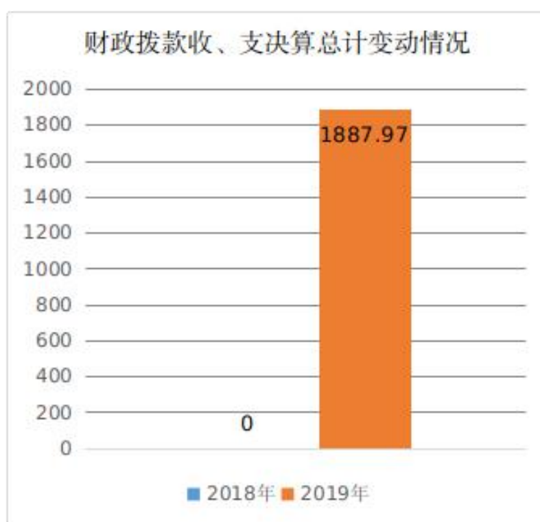
图4：财政拨款收、支决算总计变动情况

2019年度财政拨款收、支总计1887.95万元。与2018年相比，收、支总计各增加1887.95万元，增长0.0%，主要原因是本部门为2019年新增决算填报部门，填报的收入、支出等数据均无2018年数据作为对比分析依据。