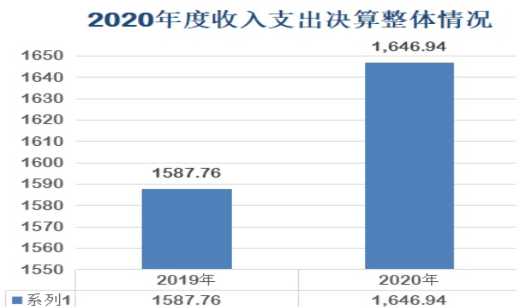
图1：收、支决算总计变动情况

2020年度收、支总计1646.94万元。与2019年相比，收、支总计各增加59.18万元，增长3.7%，主要原因是2020年新进特级教师1人，区新开办学校4所，新增教师约500人，导致人员经费、公用经费、培训费、教育发展专项经费等根据学生、教师人数测算的相关项目预算有所增加。