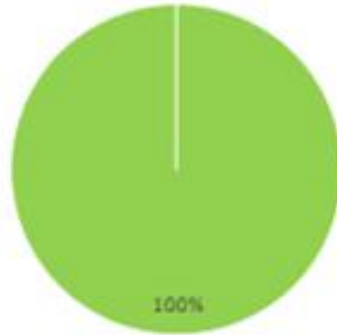
图 2: 收入决算结构