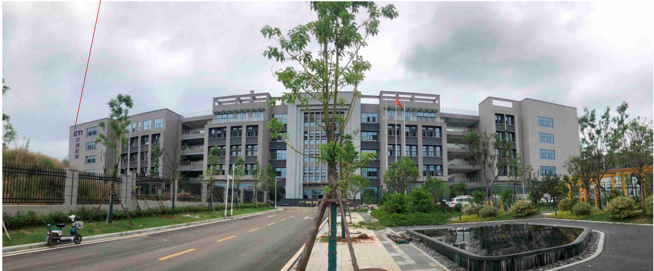
建筑名称招牌标识