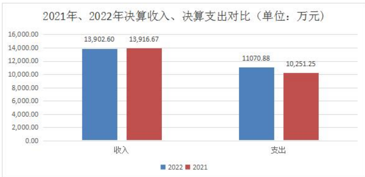
图 1：收、支决算总计变动情况

2022 年度收入合计 13,902.60 万元，本年支出合计 11,070.88 万元。与 2021 年度相比，本年收入合计减少 14.07 万元、本年支出合计增加 819.63 万元，收入减少 0.10%，支出增加 8.00%，主要原因是 1、人员经费政策性减资；2、2022 年文体活动增加，文化旅游体育与传媒经费增加；3、2022 年新增 4 个社区筹备组，社会保障和就业经费增加；4、2022 年城乡社区支出增加九峰街道还建房维修改造项目、九峰街道自建房安全隐患排查项目；5、结转上年存量的还建社区代管资金。